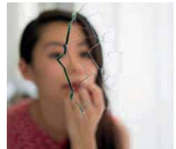
MEISTER DER MODERNE - Jiro Kamata