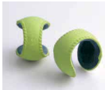
TALENTE - Ayaka Miwa