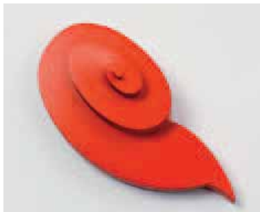
SCHMUCK - Otto Künzli